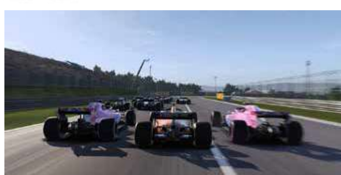
Формула 1 игра Просечно трајање: 10-15 мин