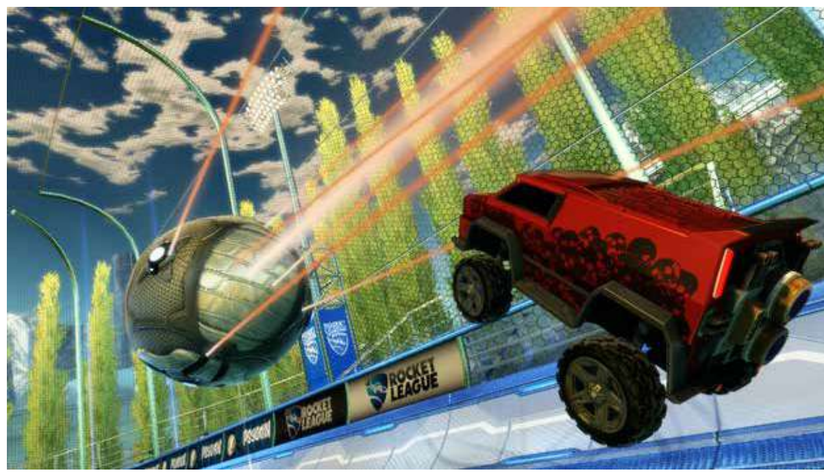
Фудбал са аутомобилима Просечно трајање: 5 мин