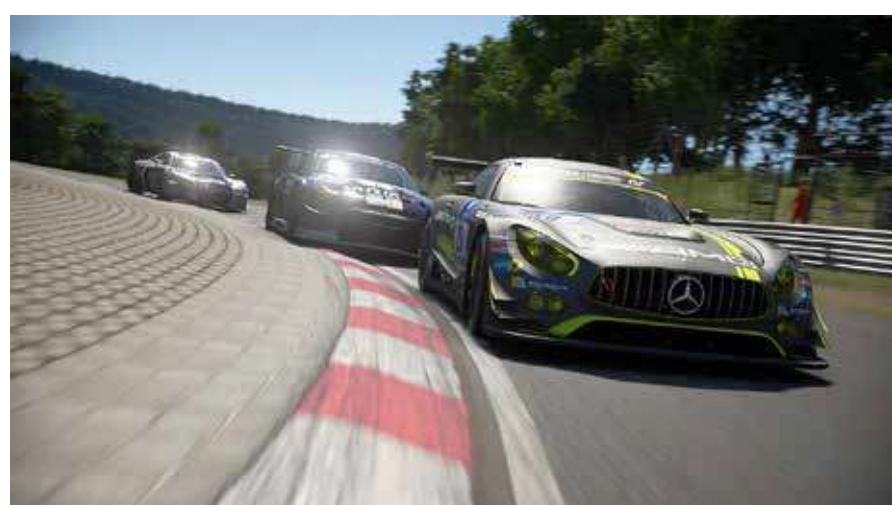
Трчка игра Просечно трајање: 5-15 мин