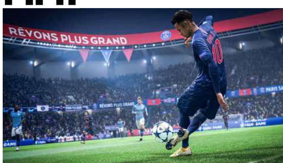
Симулација фудбала Просечно трајање: 10 мин