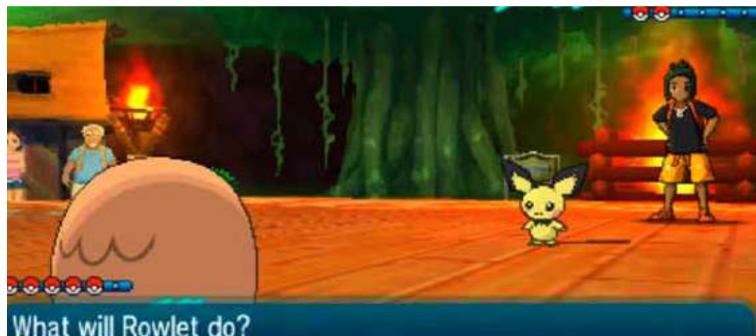
Игра скупљања хероја Просечно трајање: 10-15 мин