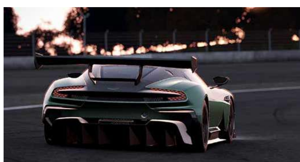
Симулација ауто трке Просечно трајање: 10 мин