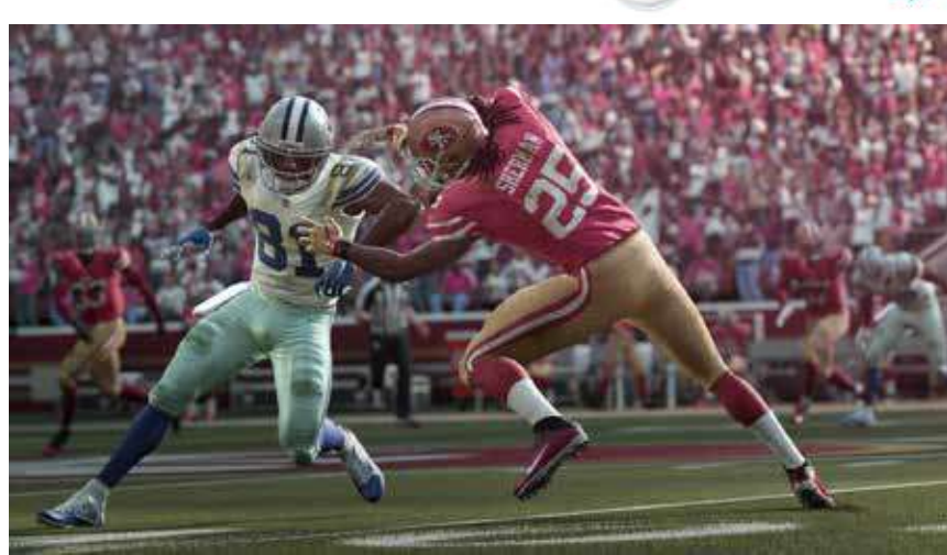
Симулација рагбија Просечно трајање: 10 мин