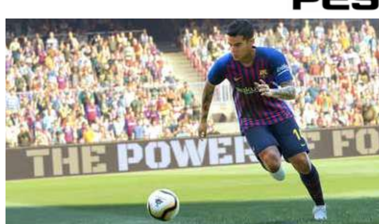
Симулација фудбала Просечно трајање: 10 мин