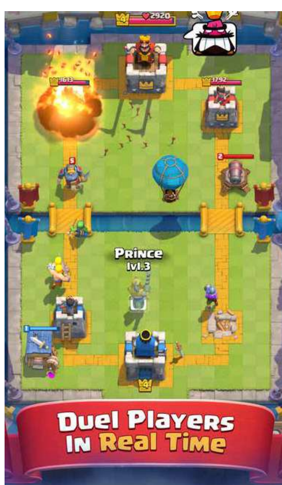
Стратешка игра одбрана куле Просечно трајање: 3 мин

Корисници морају имати 13 година да би регистровали налог да би играли